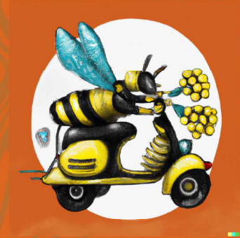
Polinización y fertilización del suelo