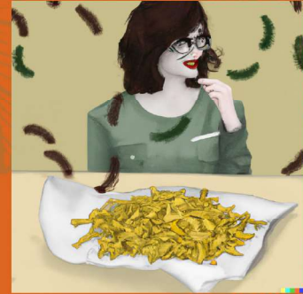
Pérdida de biodiversidad