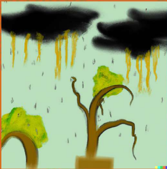
Contaminación del aire