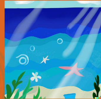
Contaminación del agua