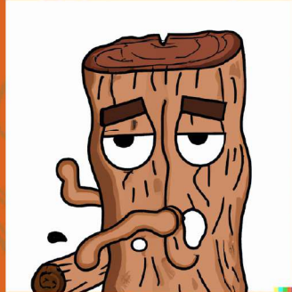
Agotamiento de recursos naturales