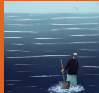
Depuración del agua