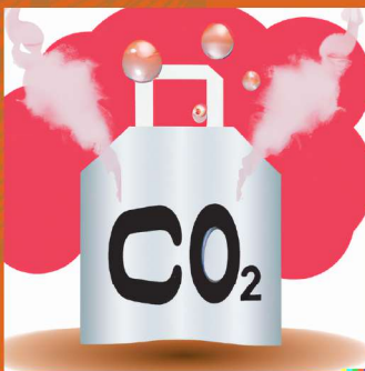
Emisiones de CO2