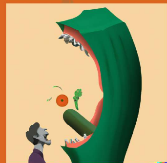
Especies en peligro de extinción